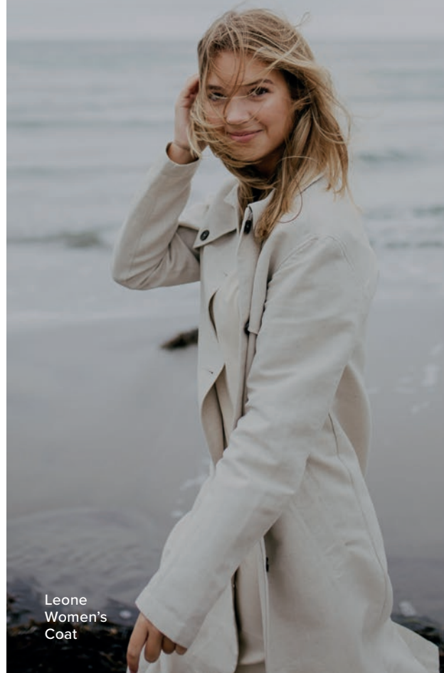
Leone Women's Coat

Didriksons grundades 1913 av Julius och Hanna Didrikson med visionen att hålla fiskare torra och varma. Över ett århundrade senare är bolaget ett av Skandinavien's ledande varumärken inom jackor och tillverkar idag plagg för hela familjen. Didriksons omsätter cirka 500 miljoner kronor, och säljs i över 19 länder med en tredjedel av försäljningen online. Bolaget ägs av Adelis Equity och har huvudkontor i textilstaden Borås.