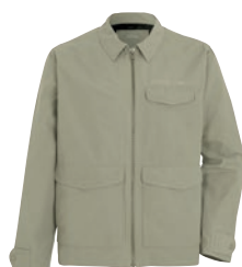
Valdemar Men's Jacket

Besök didriksons.com för att se den nuvarande kollektionen och följ @didriksons för nyheter och inspiration.