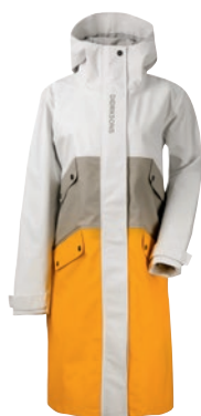
Estrid Women's Jacket 2