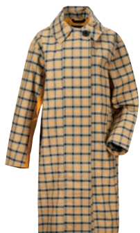
Embla Checked Women's Coat

När vi tittar tillbaka på vår historia ser vi att vi har hållit jämna steg med samtiden. För 108 år sedan höll vi familjer samman genom att skydda fiskare från kalla, hårda förhållanden till sjöss. Tiderna förändras och idag möter vi nya utmaningar. Vi tvingas att göra saker annorlunda. Det påminner oss i vår övertygelse om att värdet i att vara utomhus är större nu än någonsin tidigare. I dessa tider är vi jackvarumärket som, när det är möjligt, låter människor mötas utomhus, njuta av den friska luften, må bra och känna sig välklädda, och stanna ute längre. Detta är vad kollektionen för våren/sommaren 2021 handlar om. Under våren 2021 kommer vi att hylla livet utomhus i gott sällskap. Och du är inbjuden. Vi ses därute.