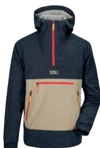
Vilmer Men's Anorak