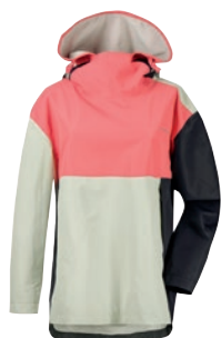
Tora Women's Jacket