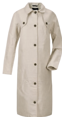
Leone Women's Coat